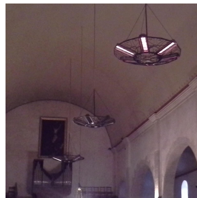
Lustres rayonnants de l'église

A l'intérieur du lustre, l'émetteur en céramique haut rendement est porté à une température de 900°C. Il produit ensuite un rayonnement infra-rouge avec un rendement de plus de 65% qui est émis directement vers la zone à chauffer. Le chauffage céramique chauffe ainsi uniquement les zones occupées sans surchauffer les parties hautes du bâtiment : l'énergie est concentrée là où elle est utile ce qui réduit la consommation au strict minimum.